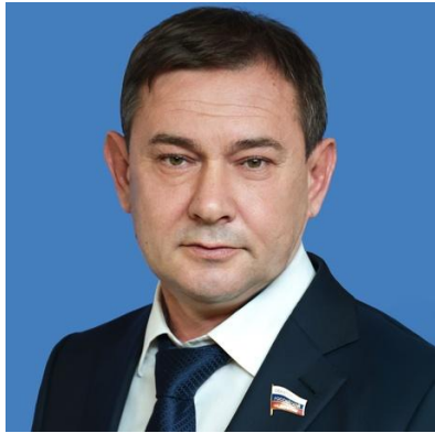
Нетесов Владимир Иванович Член Совета Федерации РФ -ДФ-