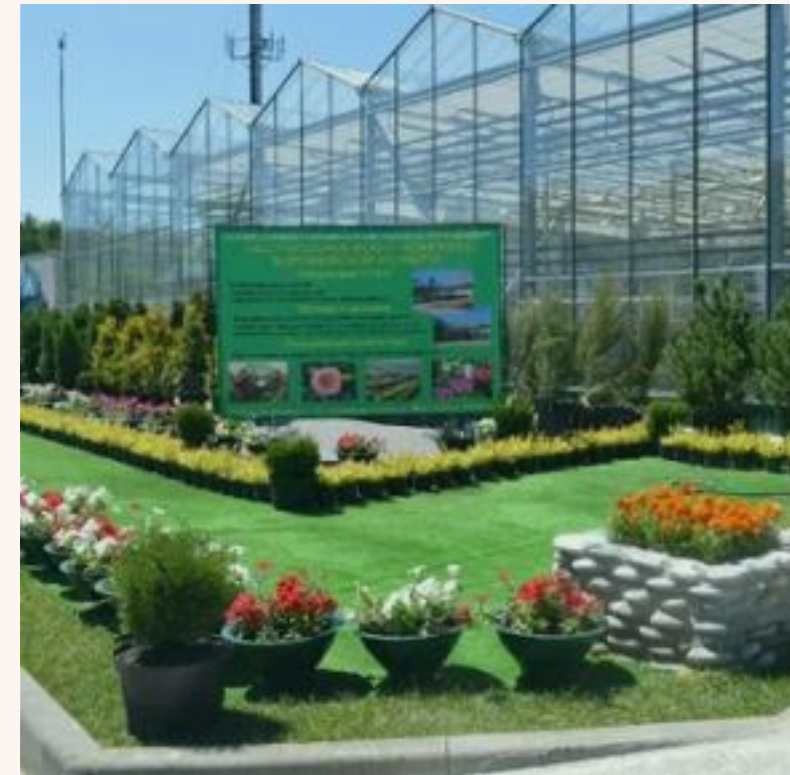
Питомнический комплекс Воронежской области