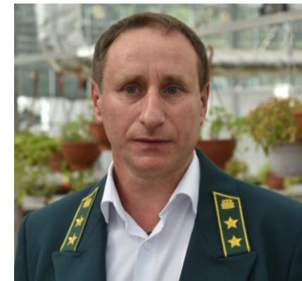
Оробинский Вячеслав Анатольевич Министр Лесного хозяйства Воронежской области -ЛФ-